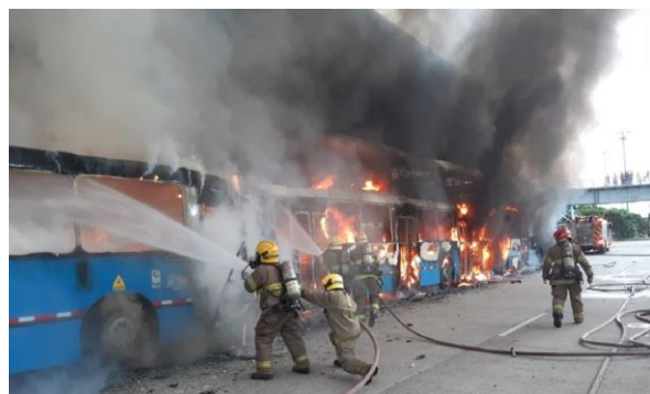
■ Buses del MIO incinerados en Cali. 28 de abril de 2021.