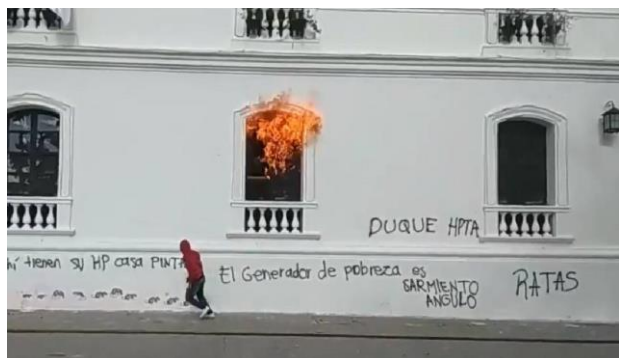
■ Violento ataque contra la alcaldía de Popayán y dos bancos. 12 de mayo de 2021.