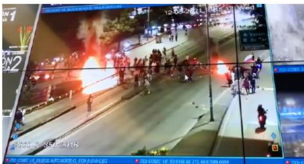
■ Desórdenes en el sur de Bogotá tras manifestaciones. 12 de mayo de 2021.