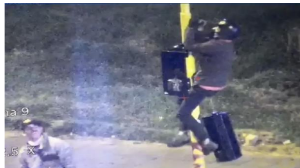
■ Dstrucción de semáforos en el sur de Bogotá. 12 de mayo de 2021.